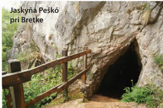
Jaskyňa Peškó pri Bretke