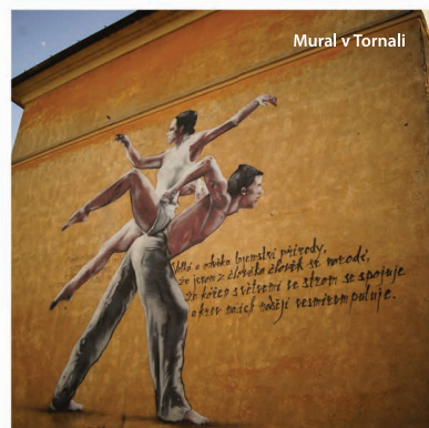
Mural v Tornali