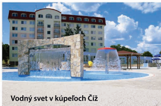
Vodný svet v kúpeľoch Číž