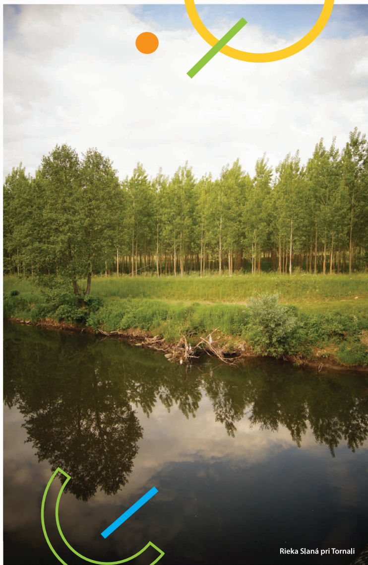
Rieka Slaná pri Tornali