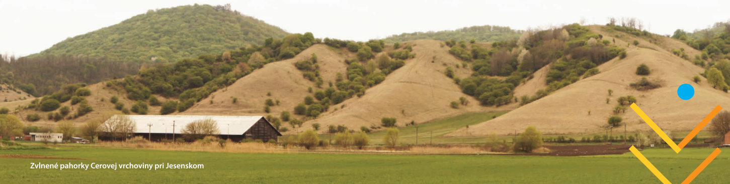
Zvlínené pahorky Cerovej vrchoviny pri Jesenskom