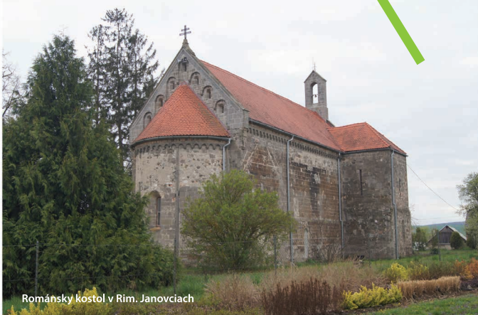
Románsky kostol v Rim. Janovciach

Jesenské je optimálnym východiskovým bodom pre všetky tieto výlety. Nájdete v ňom pestré možnosti ubytovania a stravovania: Reštaurácia Nostalgia , Penzión a reštaurácia Ascona , Stella Pizza Bar či sezónne otvorená Turistická ubytovňa v blízkosti železničnej stanice.