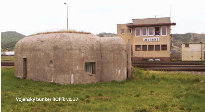
Vojenský bunker ROPík vz. 37

Severne od Tornale leží obec BRETKA - východiskový bod náučného chodníka Prielom Muráňa, rieky ktorá sa tu zarezala do vápence a vytvorila vyše 3 km dlhé údolie s jedinečnou faunou, flórou a malými jaskyňami, do ktorých možno nahliadnuť. Priamo v obci nájdete aj vojenský bunker, tzv. ROPík vz.37.